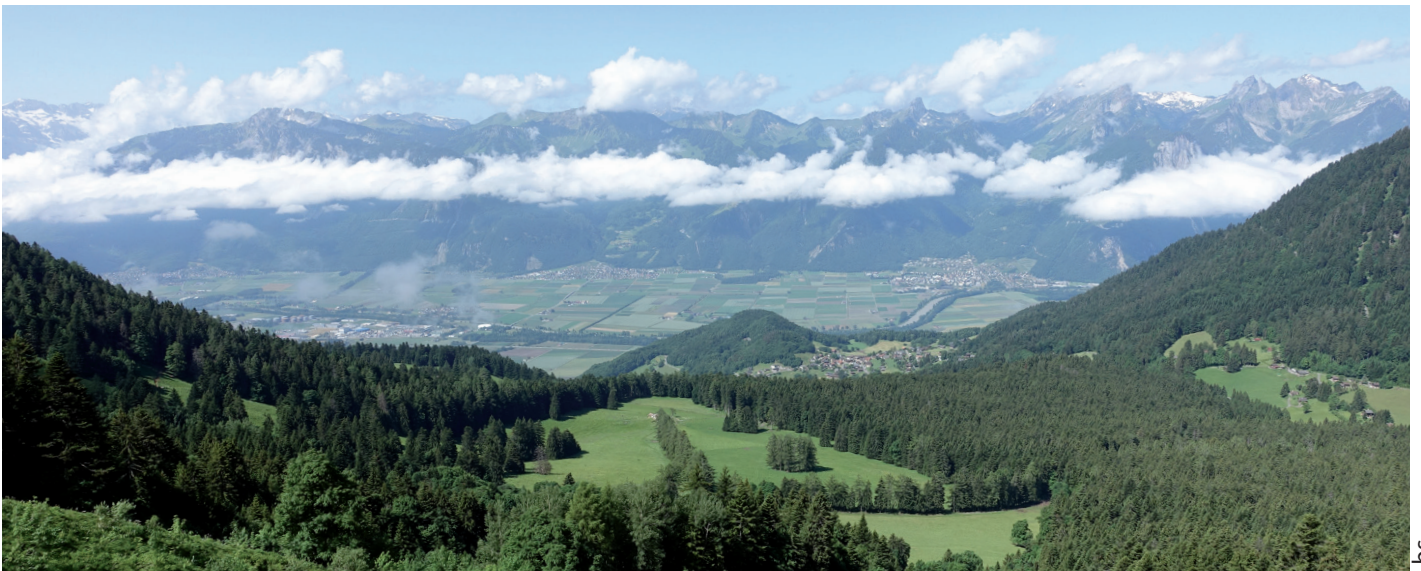
Gruppe 2 (Therese Plüss) am Montag