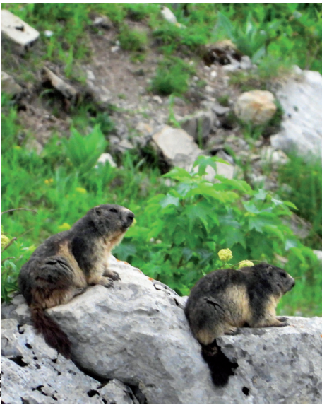
Mehrere Gruppen am Lac de Mayen am Sonntag