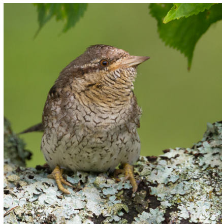
Zurückgekehrt: der Wendehals.

ein grosser Schichtholzstapel errichtet. Begleitend dazu hängte BirdLife im Frühjahr im ganzen Gebiet mehrere Wendehalsnistkästen auf. Eine der zweifellos wertvollsten Massnahmen ist die über 2 ha grosse, spezielle Grauammerbrache, die im Rahmen des BirdLife-Projekts eingesetzt wurde. Der Unterhalt dieser im Grossen Moos in seiner Grösse einmaligen Buntbrache ist jedoch pflegeintensiv. Jedes Jahr werden viele Stunden investiert, um Problempflanzen wie Blacken, Ackerkratzdisteln, Berufkraut, Goldruten oder Armenische Brombeeren zu jäten.