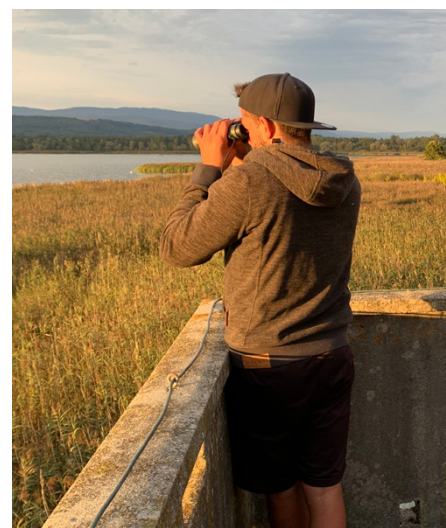
Natural Born Birders

mit dem Velo und/oder mit dem öV. Dabei zählen sie alle Vogelarten, die sie finden. Man muss nicht jeden seltenen Vogel erkennen – entscheidend ist, dass nur die sicher bestimmten Arten notiert werden. Erstmals werden dieses Jahr auch regionale Ranglisten geführt – niemand muss also ins Fanel reisen, um einen Preis gewinnen zu können. Die Regeln und die Anmeldung sind unter birdlife.ch/birdrace zu finden. Oder möchten Sie ein Team als Sponderin oder Spender unterstützen? Infos finden Sie in der Beilage .