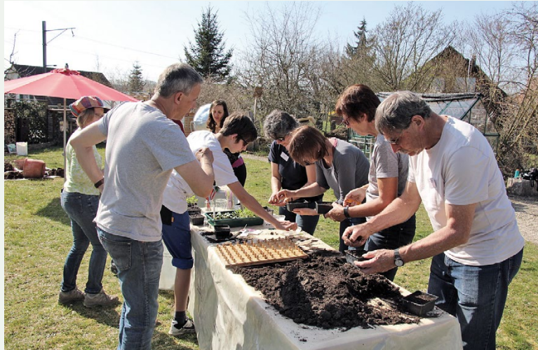
Links: Naturgartenkurs in Dachsen. Unten: BirdLife-Ornithologiekurs in der Romandie.

Natürlich wird vor allem der Organisationsaufwand einige Sektionen davon abhalten, selber einen Kurs durchzuführen. Der aufwändigste Teil der Arbeit (Durchführen der Anlässe, Bearbeiten des Kursskriptes) wird allerdings von den ReferentInnen getragen, und diese Experten müssen nicht aus dem Verein sein. Wichtig ist, sie angemessen zu entschädigen (siehe nächste Seite). Die restliche Arbeit für die Sektion ist dann überschaubar – und vor allem stehen schon sehr viele Materialien und Umsetzungshilfen bereit, die nur noch angepasst werden müssen (Übersicht siehe Seite 8).