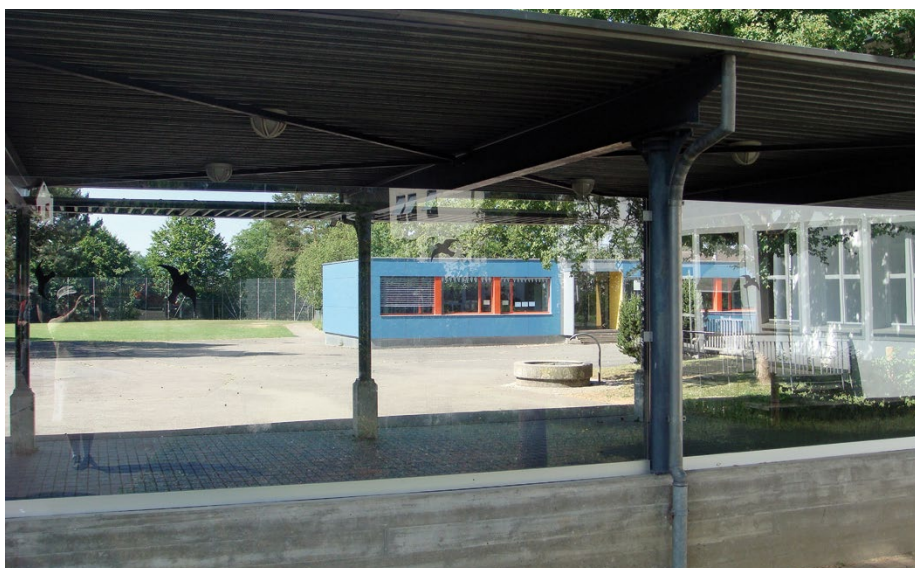
Noch immer vielerorts zu finden: ungesicherte, fast unsichtbare Glasscheiben.