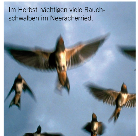
Im Herbst nächtigen viele Rauchschwalben im Neeracherried.