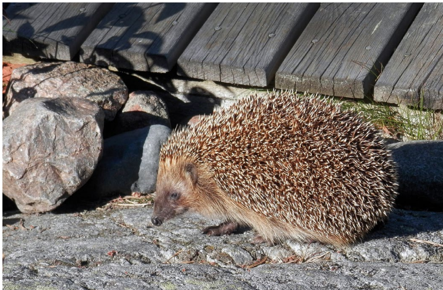
Igel und andere kleine Tiere können höhere Absätze oft nicht überwinden.

Zahlreiche Tierarten nutzen Siedlungen als Teil ihres Lebensraumes. Doch lauert im Siedlungsraum auch eine Vielzahl an Gefahren auf sie. Amphibien und Reptilien fallen in die Kanalisation und können kaum mehr hinauskriechen. Kellerabgänge oder Lichtschächte werden ihnen zum Verhängnis. Schwimmbecken, Wassertonnen oder offene Güllebecken sind für Vögel und Insekten Todesfallen. Strassen fordern unzählige Verkehrsoffer. Spiegelnde Glasscheiben, Windfänge oder Wintergärten zählen zu den grössten «Vogelkillern». Nicht selten purzeln Jungvögel in offene Kamine. Zäune bis zum Boden und Netze verhindern die Durchgängigkeit. Über 20 cm hohe Mauern sind ebenfalls Hindernisse für Igel, Amphibien und Kleinsäuger. Fadenmäher und Rasenroboter mähen nicht nur Rasen und