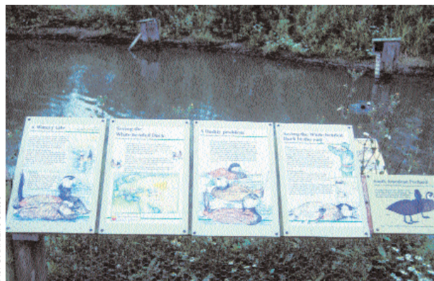
Les éristatures rousses posent problème surtout en Espagne. Elles ont été introduites à la fin des années 1940 en Angleterre où elles étaient appréciées dans les volières en tant qu'oiseaux d'ornement.

Bien que les mesures de revitalisation des biotopes aient commencé à déployer des effets, l'éristature à tête blanche est à nouveau menacée d'extinction. L'hybridation est si poussée que l'on rencontre déjà des hybrides des 2e et 3e générations (voir titre des photos). Des mesures visant à protéger l'éristature européenne contre un croisement avec l'éristature rousse sont donc urgentes.