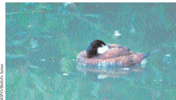
Un plan d'action international exige l'élimination de l'Éristature rousse en Europe.

Comme l'éristature rousse n'est pas une espèce indigène, sa détention ne nécessite pas d'autorisation, ce qui augmente le risque que de nouveaux individus s'échappent et viennent grossir le nombre d'éristatures rousses dans notre pays.