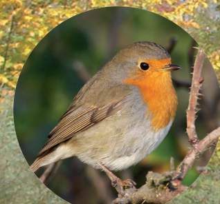
10 Rougegorge familier