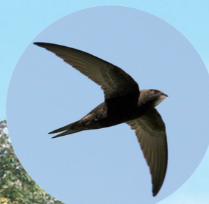
5 Martinet noir