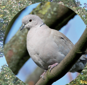
3 Tourterelle turque