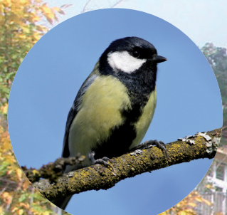
1 Mésange charbonnière