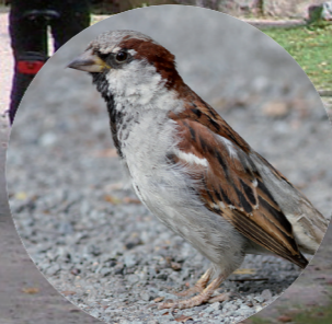
18 Moineau domestique