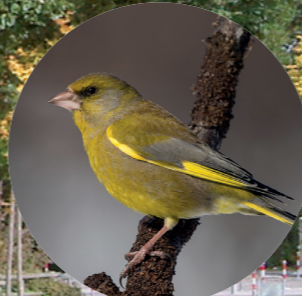
13 Verdier d'Europe