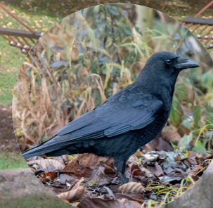
16 Corneille noire