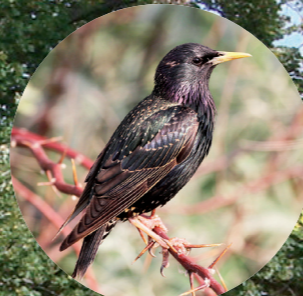
8 Etourneau sansonnet