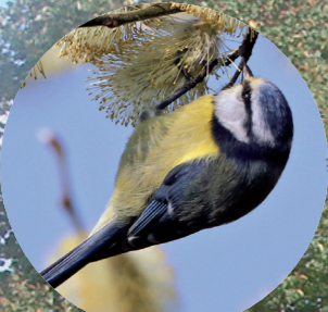
2 Mésange bleue