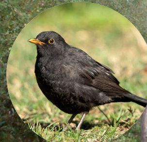
15 Merle noir