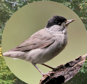
11 Fauvette à tête noire