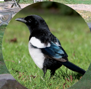
17 Pie bavarde