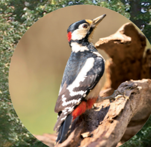
7 Pic épeiche