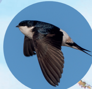
6 Hirondelle de fenêtre