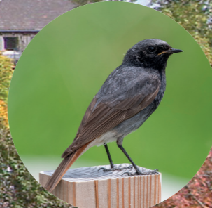
14 Rougequeue noir