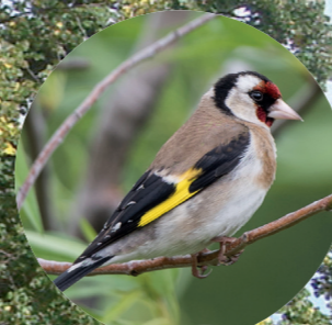
9 Chardonneret élégant