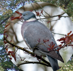
4 Pigeon ramier