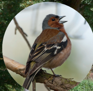
12 Pinson des arbres