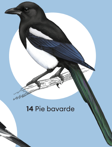
14 Pie bavarde