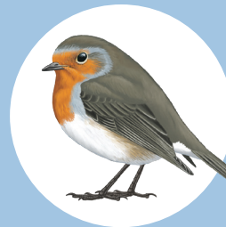
5 Rougegorge familier