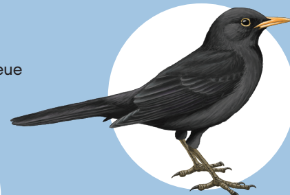
4 Merle noir