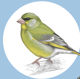
9 Verdier d'Europe