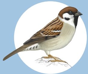
7 Moineau friquet