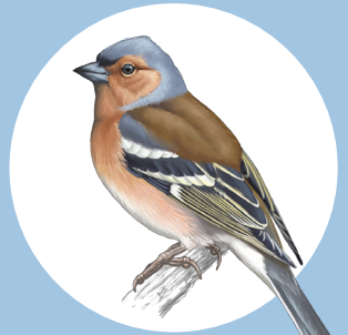
10 Pinson des arbres