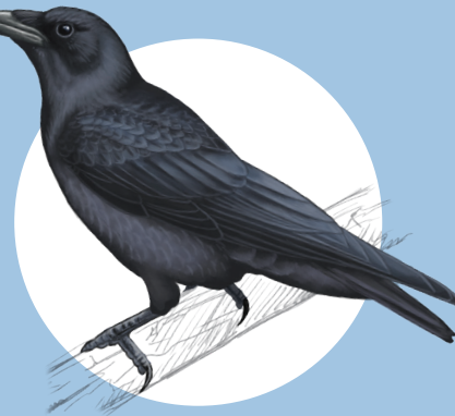
13 Corneille noire