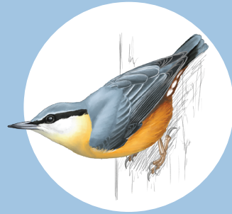
12 Sittelle torchepot