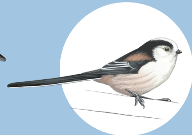
3 Mésange à longue queue