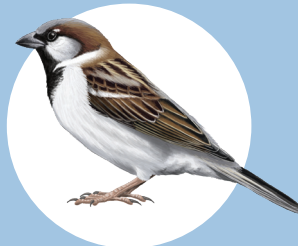
6 Moineau domestique