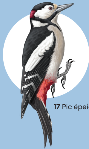
17 Pic épeiche