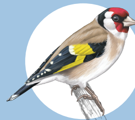
8 Chardonneret élégant