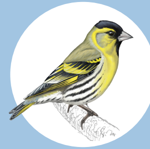
11 Tarin des aulnes