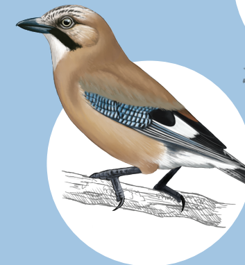
15 Geai des chênes