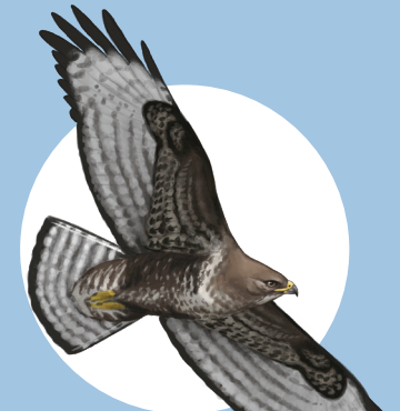
19 Buse variable