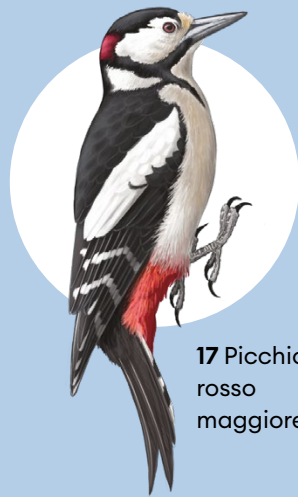
17 Picchio rosso maggiore