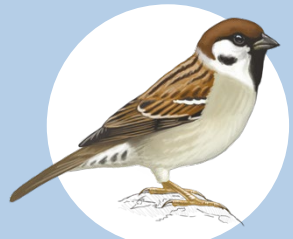
7 Passera mattugia