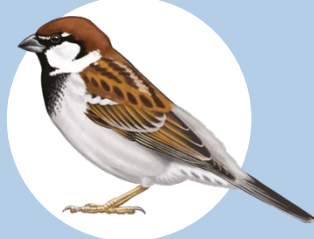
6 Passera d'Italia