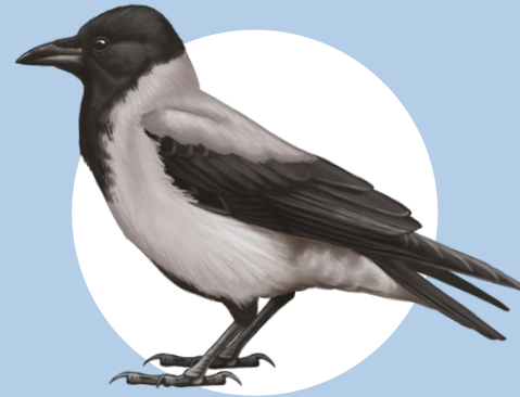
13 Cornacchia grigia