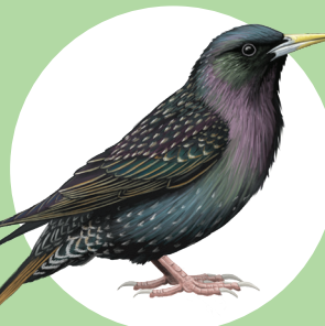
8 Etourneau sansonnet