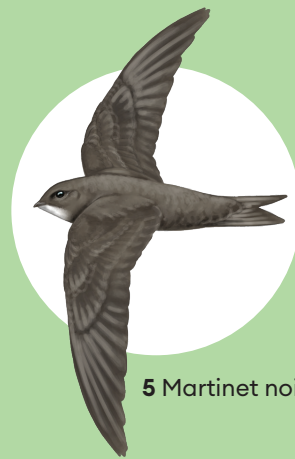
5 Martinet noir