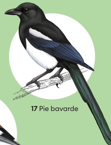
17 Pie bavarde