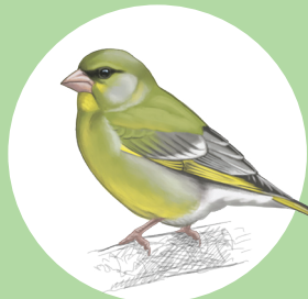
13 Verdier d'Europe