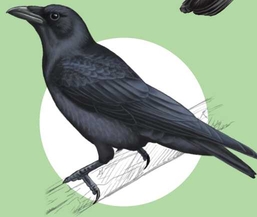
16 Corneille noire