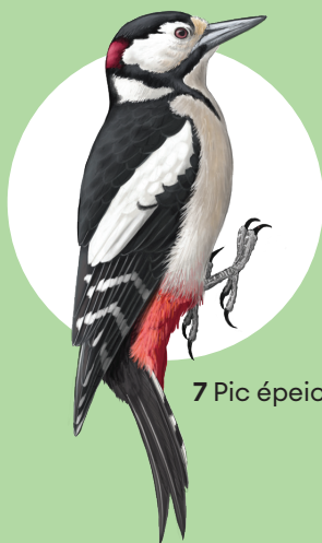
7 Pic épeiche