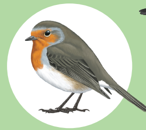
10 Rougegorge familier