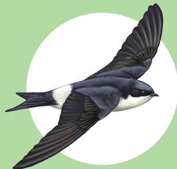
6 Hirondelle de fenêtre