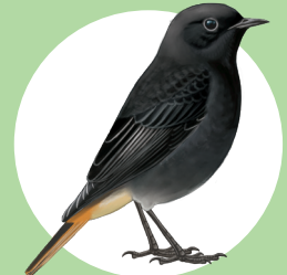
14 Rougequeue noir