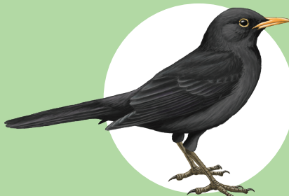
15 Merle noir