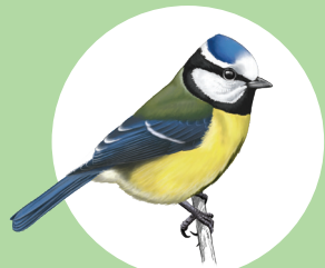
2 Mésange bleue