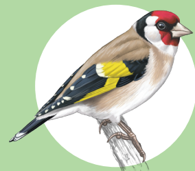
9 Chardonneret élégant