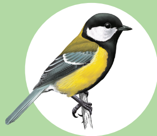
1 Mésange charbonnière