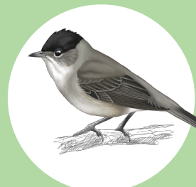
11 Fauvette à tête noire