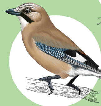
19 Geai des chênes