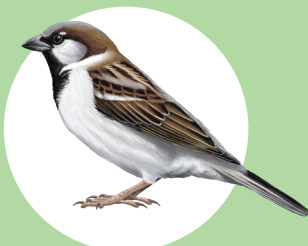
18 Moineau domestique