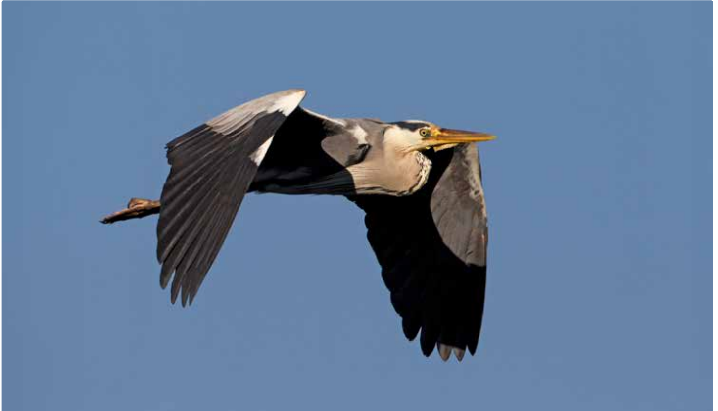
Héron cendré