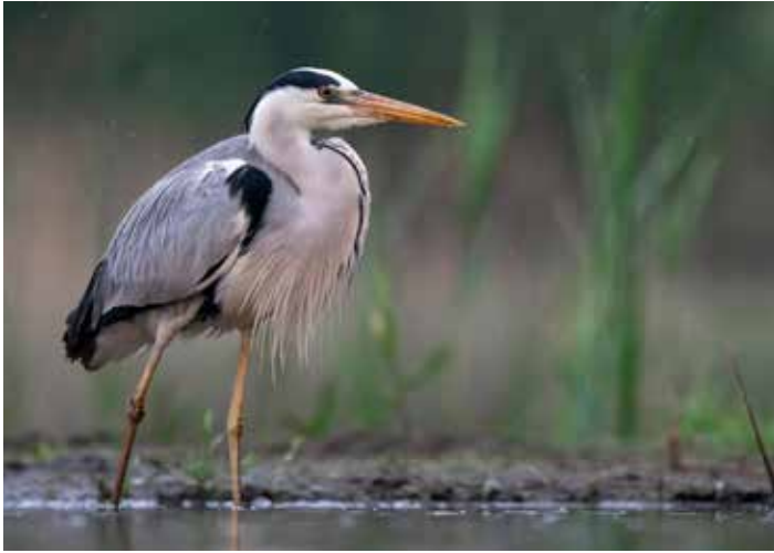
Peu farouches, les hérons cendrés investissent parfois aussi les mares des parcs et jardins.