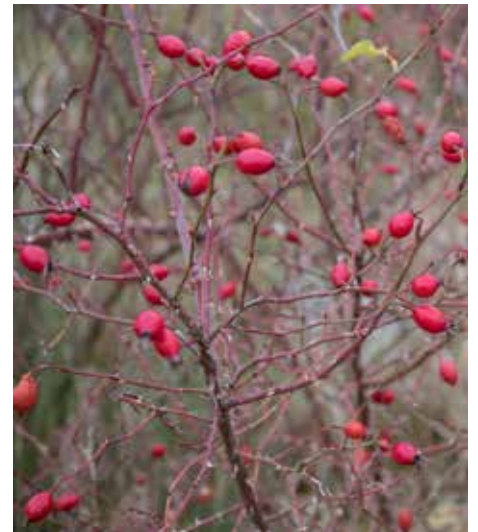
Les fruits des églantiers sont appréciés de différentes espèces d'oiseaux. Grâce à leurs épines, les églantiers offrent par ailleurs des lieux de nidification protégés.