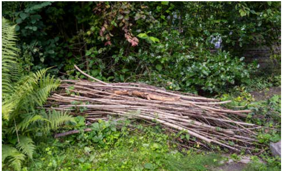
On peut entasser les déchets de coupe à un endroit peu utilisé du jardin. Ils offriront alors un refuge aux oiseaux, aux hérissons et à d'autres petits animaux.

En hiver, la coupe des arbustes à baies devrait être effectuée le plus tard possible car leurs fruits sont une source de nourriture importante pour la faune. Les feuilles mortes laissées sous les buissons en automne ont plusieurs avantages : ce n'est qu'ainsi qu'un sol idéal à la strate herbacée typique des haies peut se développer. De plus, le hérisson construit son nid de feuilles mortes caché sous les brindilles pour y hiberner et y élever ses jeunes. Les déchets de coupe ne doivent donc pas forcément être hachés ou éliminés, mais peuvent être empilés en un tas précieux pour la faune.