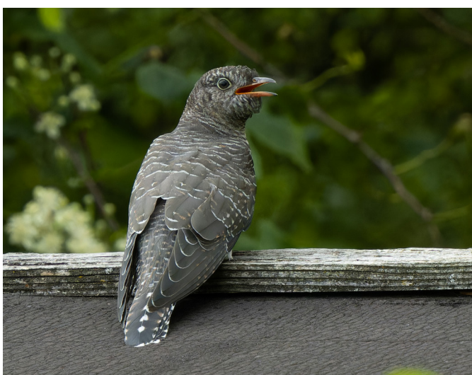
Le coucou gris, célèbre pour son parasitisme de couvée, confie l'élevage de ses petits à d'autres oiseaux en déposant ses œufs dans leurs nids.

A la ferme de La Sauge, un couple de faucon crécerelle et un d'effraie des clochers ont niché côte à côte dans des nichoirs spécialement installés. Début juillet, cinq jeunes faucons crécerelles ont pris leur envol. Malheureusement, un problème technique avec la caméra du nichoir des effraies des clochers a empêché de suivre le déroulement en direct de leur reproduction et de déterminer le nombre de jeunes.