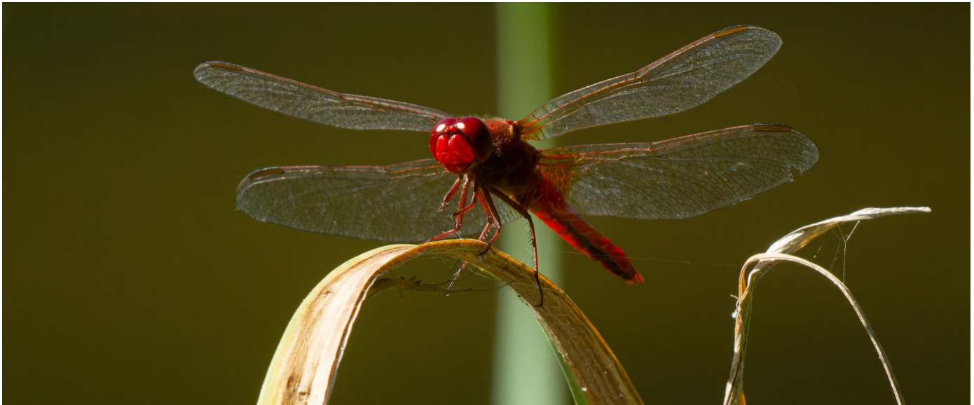
Le crocothémis écarlate est une libellule flamboyante, reconnaissable à sa couleur rouge vif, souvent observée le long du petit canal à La Sauge.

56 % des observations de canards de surface ont été réalisées durant le premier semestre de l'année.