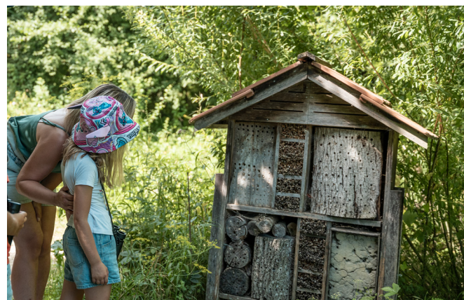
Découverte des insectes de l'hôtel.

Cette année encore, les formations pour le corps enseignant ont été menées avec succès au Centre-Nature BirdLife de La Sauge.