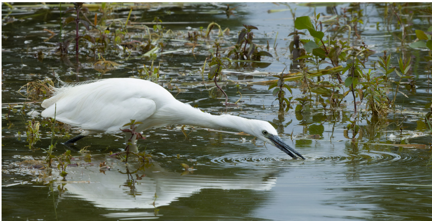
Observée à La Sauge, l'aigrette garzette chasse dans les eaux peu profondes avec une précision remarquable.

l'observation des insectes et à leur donner des outils pour organiser des activités ludiques avec leurs élèves.