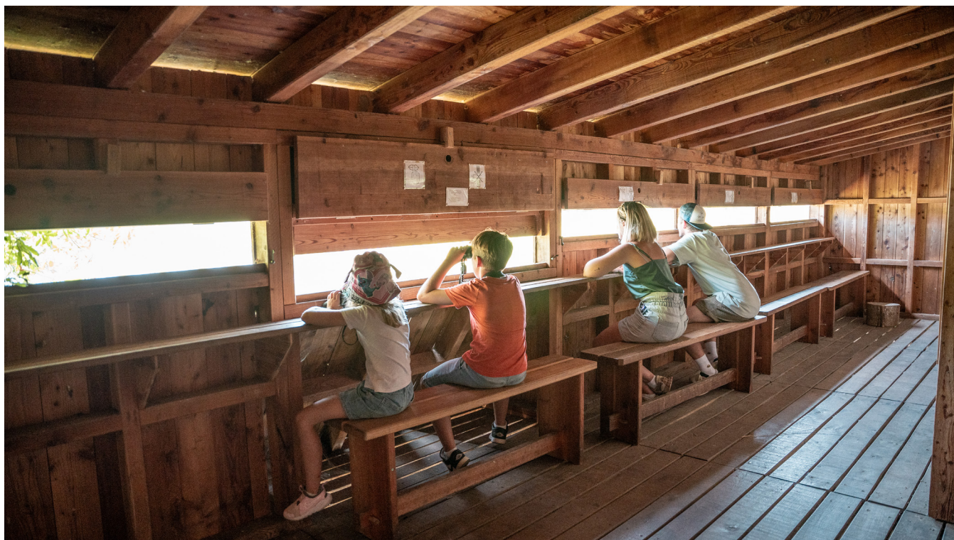
Observation d'oiseaux dans leur habitat naturel dans l'observatoire.