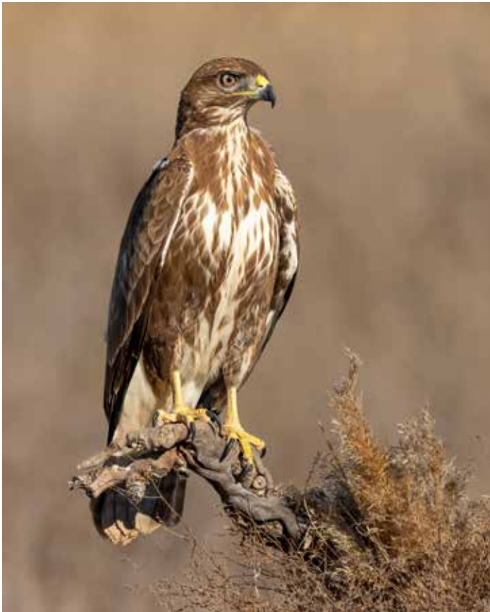
La buse variable chasse à l'affût, ce qui signifie qu'elle se pose à un endroit en hauteur d'où elle cherche ses proies du regard.