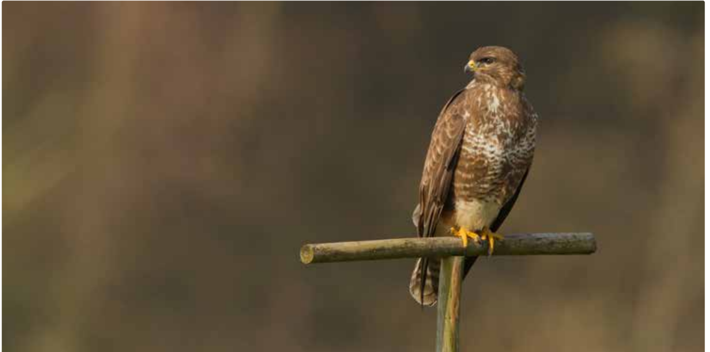
Buse variable